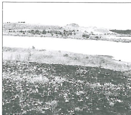
Søby brunkulslejer i gamle dage.

I dag har Danmarks største entreprenørvirksomhed 4.900 ansatte og en årsomsætning på 10,3 milliarder kroner.