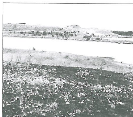
Søby brunkulsejer i gamle dage.

I dag har Danmarks stør- ste entreprenørvirksomhed 4.900 ansatte og en årsom- sætning på 10,3 milliarder kroner.