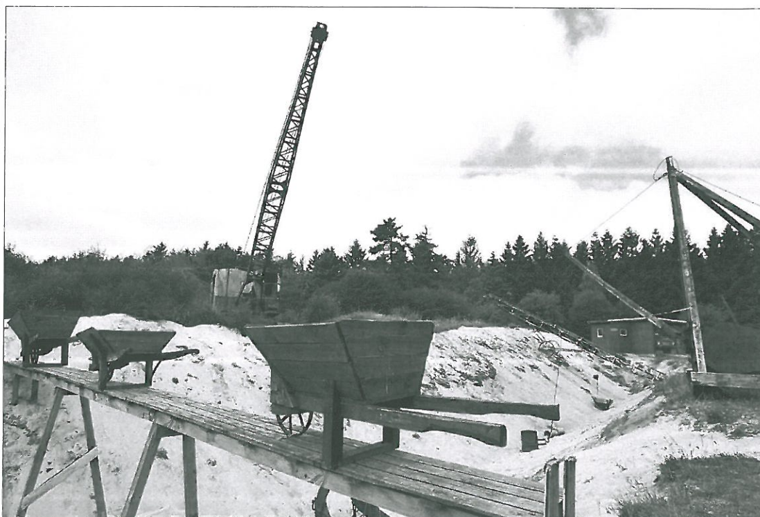
Arkivfoto fra en udgravning ved Søby Brunkulsmuseum.

Det er Varde og Ølgodegnens LandboUngdom, der har planlagt et fagligt arrangement i samarbejde med KMC med fokus på kartoflens mange forskellige anvendelsesmuligheder. Der bliver blandt andet mulighed for at følge kartoflernes vej fra indlevering, til de er klar til at blive sendt ud til slutbrugeren. Der kræves tilmelding til arrangementet, og tilmelding skal ske til foreningen. -AST